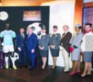
«الاتحاد للطيران» تحتفل بالشر الجديدة مع «نيويورك سيتي»